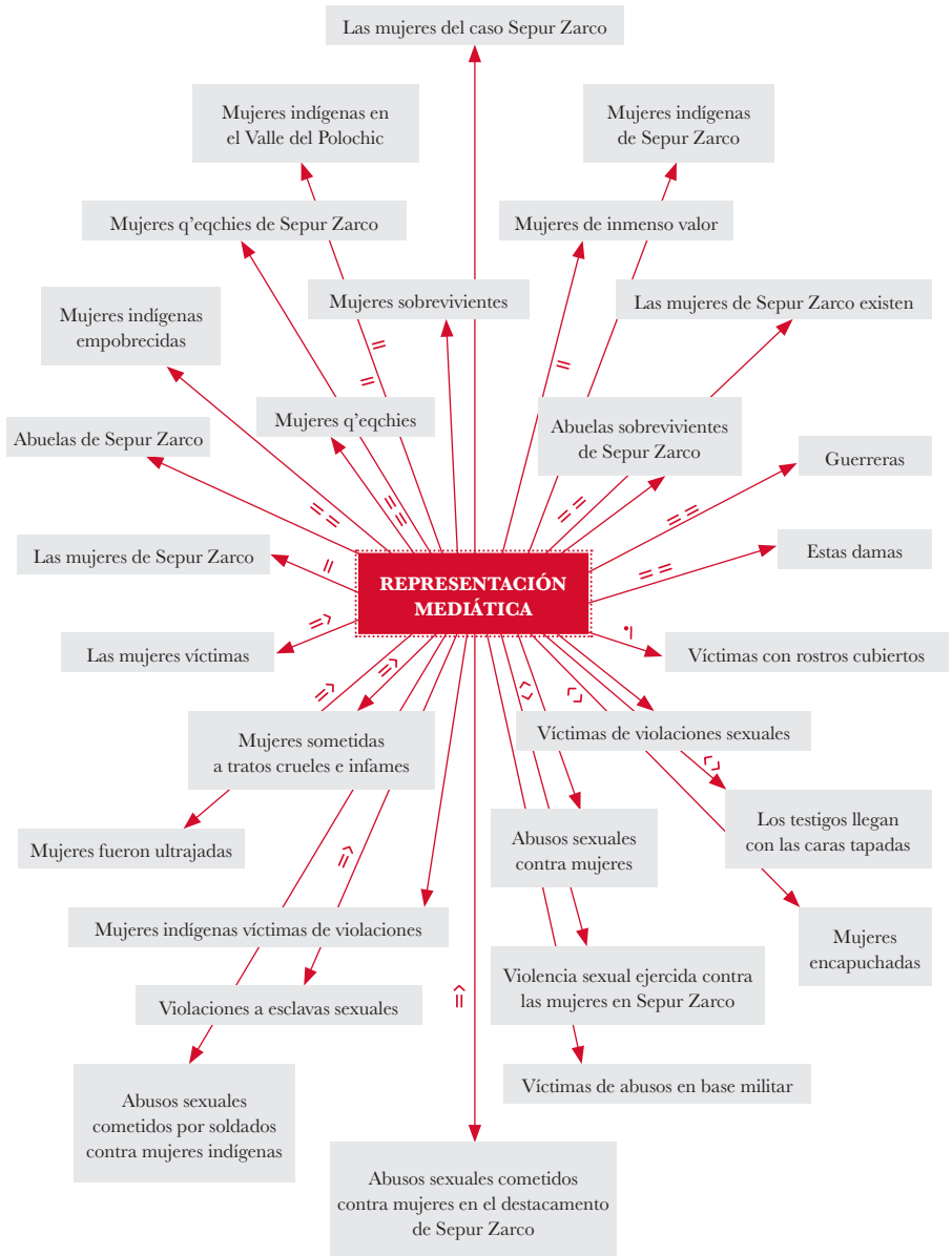
Figura 2. Palabras descriptoras y de representación mediática del caso Sepur Zarco, 2016