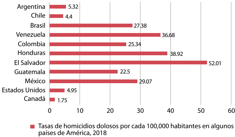
Figura 2. Tasas de homicidios dolosos por cada 100 000 habitantes en algunos países de América, 2018